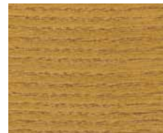
0868 EICHE HELL