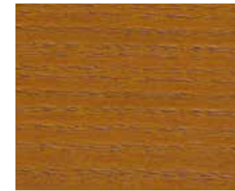
10009 EICHE DUNKEL