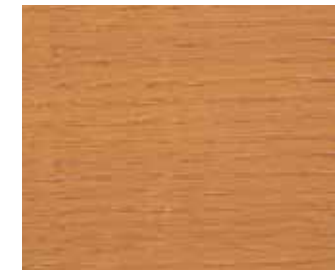
0935 SIBIRISCHE LÄRCHE