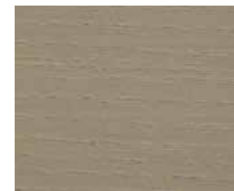
0934 SILBERGRAU HELL