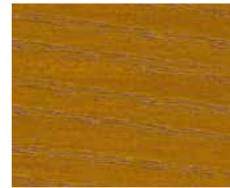
10083 EICHE ANTIK