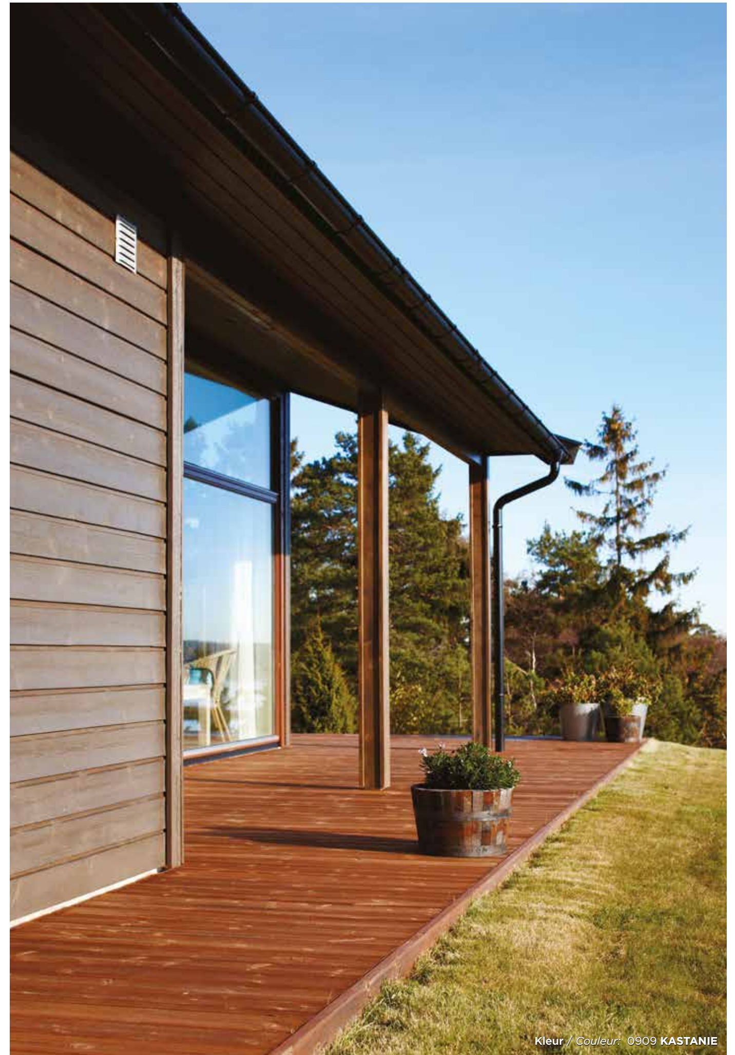
Kleur / Couleur: 0909 KASTANIE