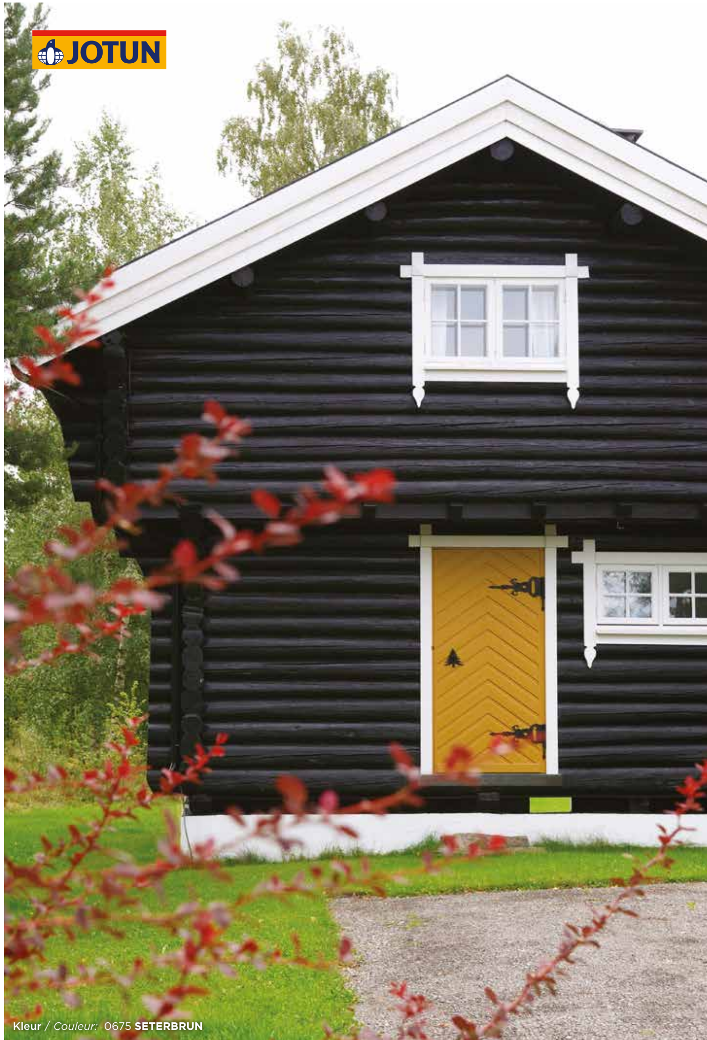
Kleur / Couleur: 0675 SETERBRUN